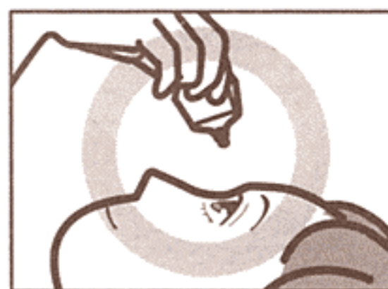
容器の先を下に向けて点眼