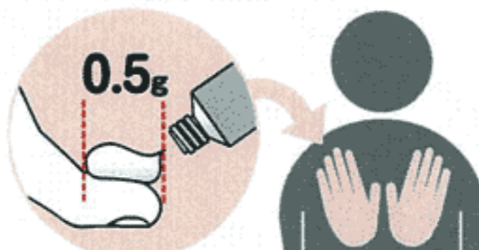
大人の手のひら2枚くらいの広さに伸ばします

チューブから、大人の人差し指の第一関節の長さくらい（約0.5g）を出した場合、大人の手のひら2枚くらいの広さに伸ばして塗ります。これを目安として、患部の広さと比較して使用量を決めます。