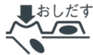
(PTPシートの取り出し図)

右図のように錠剤の入っているPTPシートの凸部を指先で強く押して裏面のアルミ箔を破り、取り出してお飲みください。(誤ってそのまま飲み込んだりすると食道粘膜に突き刺さるなど思わぬ事故につながります。)